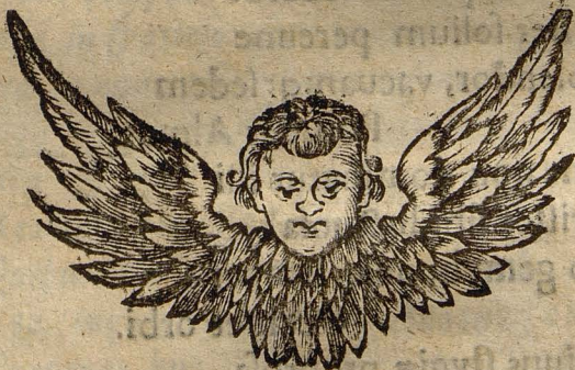
Fig. 1. 12.

Ergo iam votis paribus fideles Vocibusq; altis resonemus omnes, Sideri gratam recinamus lo Ib triumpho