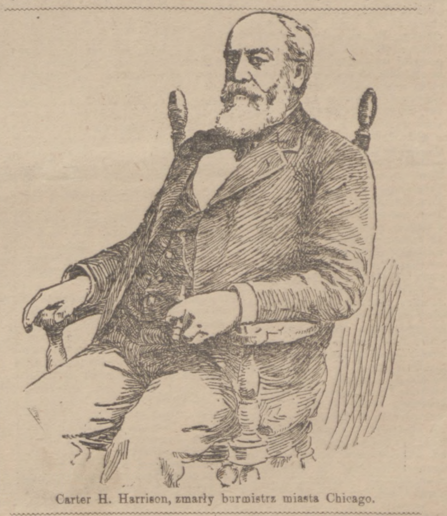
Cartier H. Harrison, zmarły burmistrz miasta Chicago.

Cartier H. Harrison burmistrz miasta Chicago zastrzelony w sobotę wieczorem na progu swego pokoju.