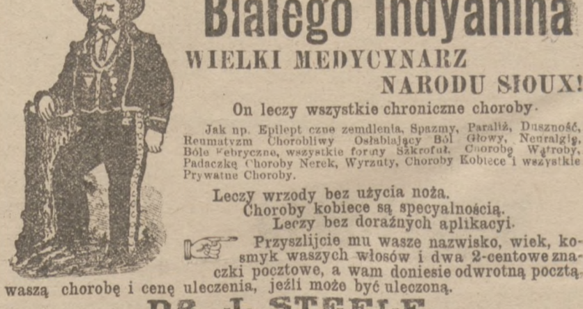
Białego Indianina WIELKI MEDYCYNARZ NARODU SIOUX!