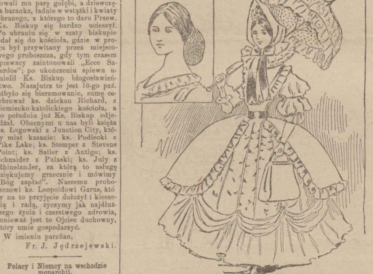
Najnowsze mody paryskie.