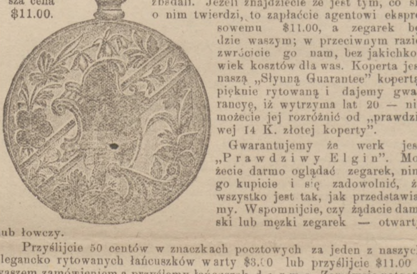
Elgin Zegarek za $1.50. PEŁNIĄCY KOSZTA EXPRESSOWE.