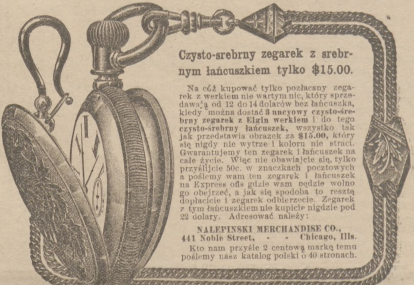
Słynny zegarek... Prawdźwiy Elgin zegarek darmo i ekspresie kosztu zapłacone.