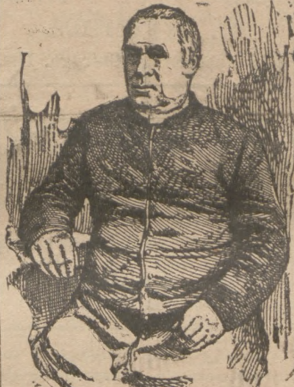
Ks. Sebastian Kneipp.

Z Monachium, w Niemczech, donoszą dnia 17 bm., że w Woerishoffen umazł ks. Sebastian Kneipp, słynny na cały świat ze swej "metody leczenia wodą".