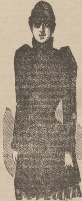
Halb-Paletots ca. 80 cm lang mit Fischbein-Einlage. In Selden-Brocéat 27 M. " Crefelder Seiden-Plüsch 33 M. " Engl. Seiden-Plüsch 46 M.