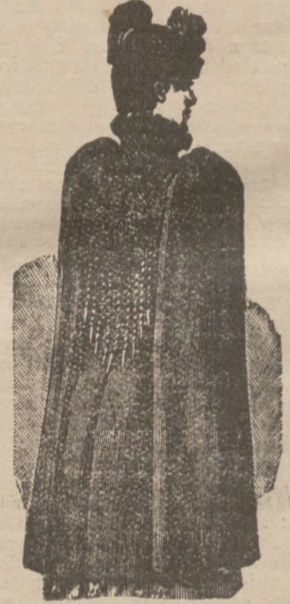
Capes (Moderne Umhänge). In Woll-Damassé 29 M. " Seiden-Brocéat 39 M. " Seiden-Plüsch 54 M.

Saison-Neuheit: Hahn-Feder-Boas, 2,50 Meter lang, unübertroffen glanzreich und dicht,