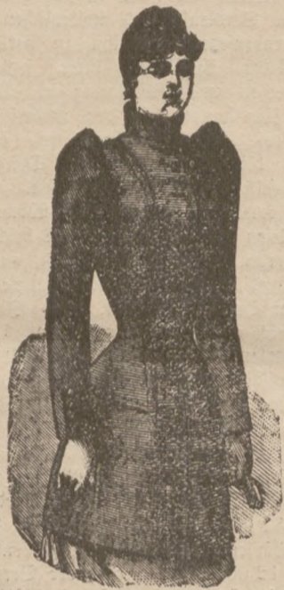
Halb-Paletots ca. 80 cm lang mit Fischbein-Einlage. In Astrachan 10 M. " Corkskrew 12 M. " Foulé 14 M.