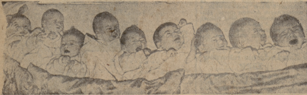
...A oto przyszli redaktorzy „Piłkarza”