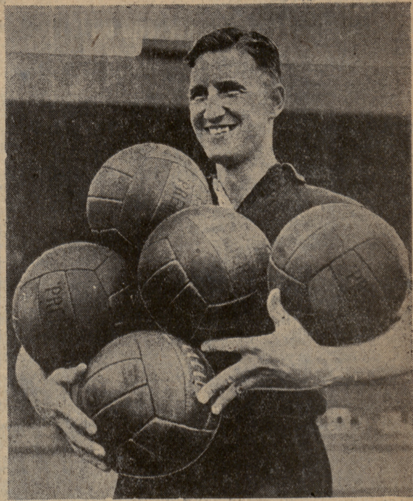
Przerwa zimowa skończona. Wczoraj po raz pierwszy w tym roku piłkarze nasi wyszli na boiska.