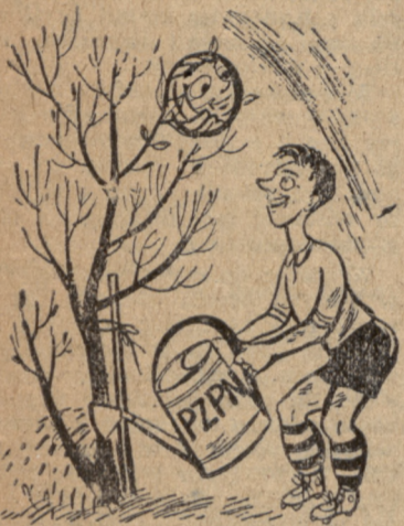
Pierwszy zwiastun wiosny