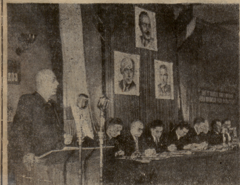
W ubiegły czwartek odbyło się w Warszawie uroczyste posiedzenie Głównego Komitetu Kultury Fizycznej. Na posiedzenie to przybył prezes Rady Ministrów J. Cyrankiewicz. Na zdjęciu: premier Cyrankiewicz wygłaszający przemówienie.