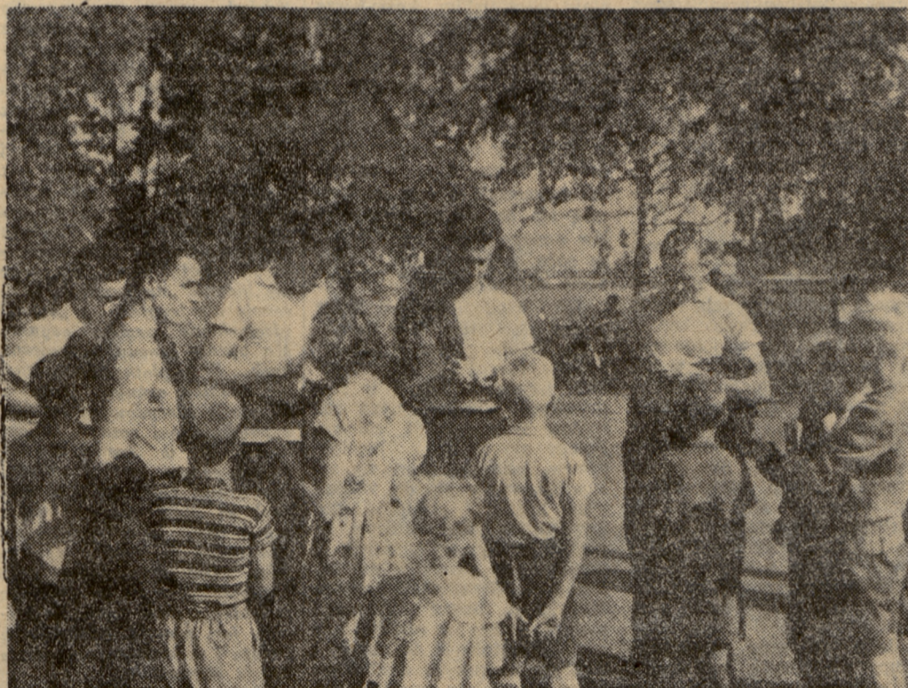
Polscy wioślarze w Otaniem obiegani przez młodzieżowych łowców autografów.