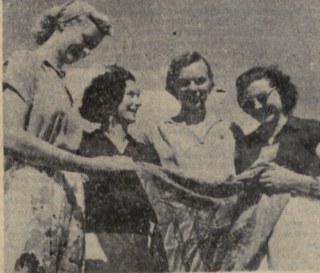
Spotkania między młodzieżą różnych narodów przyczyniają się do zaciesniania węzłów przyjaźni i braterstwa. Na zdjęciu: Radzieckie lekkoatletki w towarzystwie lekkoatletek polskich.

...przy starcie do wyścigów konnych konie są wypuszczane ze specjalnego urządzenia „startowego”? Składa się ono z 4 do 6 elastycznych taśm, zamykających trasę w miejscu startu, które na sygnał równocześnie i błyskawicznie zostają przez specjalny mechanizm ściągnięte.