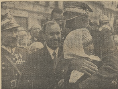
Entuzjastyczne powitanie Wojska Polskiego na Zaolziu.

Przez włączenie Zaolzia powiększyła się Polska o całe dwa powiaty a to cieszyński i fryszlacki oraz wschodnią część powiatu frydeckiego i 7 miast a to Bogumin, Karwinę, Orłow, Fryszlad, Cieszyn Zachodni, Trzynieć i Jabłonków,