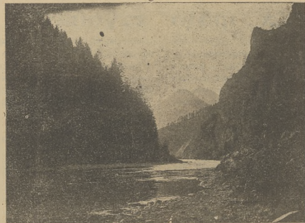
PIĘKNA OKOLICA SZCZAWNICY—PIENINY

A przy tym cudne Pienny... Każdy kto chce wzmocnić zdrowie, użyć sportu i nacieszyć się naprawdę pięknem zimy spiesz do Szczawnicy.