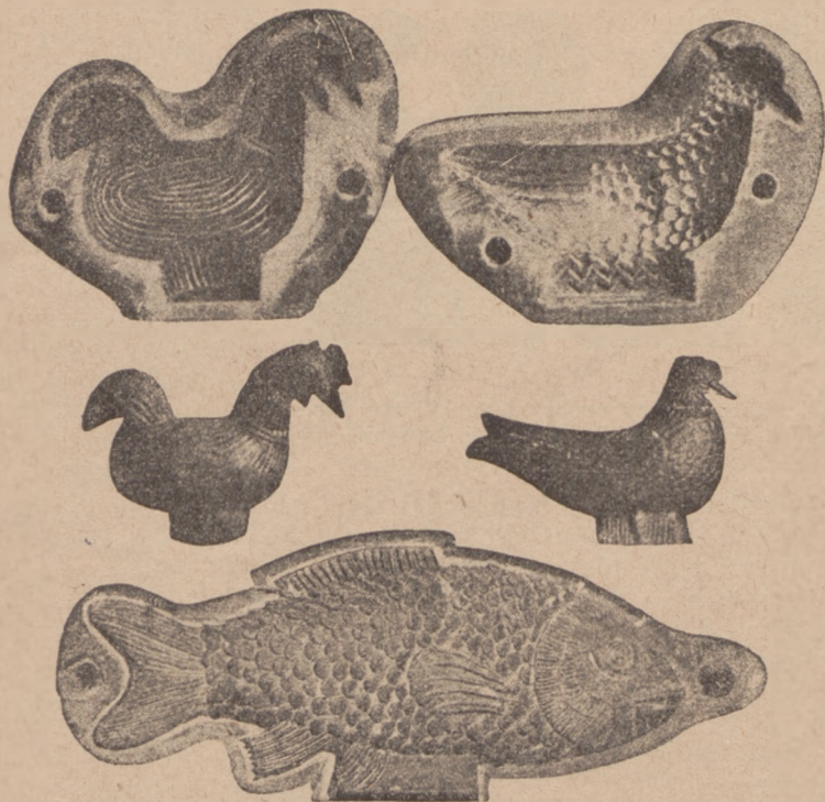
Formy na serki owcze i dwa serki: kogutek i gołąbek. (Jurków, pow. Limanowa).

rozwodnik — po którym albo przysuwa się kocioł ku ognisku lub się od niego oddala. Góral wyjaśnił nam, że mleko doi się do dojnicy, zwanych gielatami i zlewają je albo wprost do kotła albo do faski o 1\frac{1}{2} ćwierci objętości zwanej putyrą. Mleko zaklaga ne po godzinie stawia się w kotle nad ogniem, by się ściał ser, który następnie rękami ugniatają w jedną bryłę i składają do saty, w której wisi dopóki nie ocieknie z żętycy. Gdyby zawczasie wyjęli z saty, to ser jeszcze ocieka i to się nazywa, że „ser płacze“. Pozostałą po wyjęciu sera żętycę warzą jeszcze w kotle i następnie piją ciepłą.