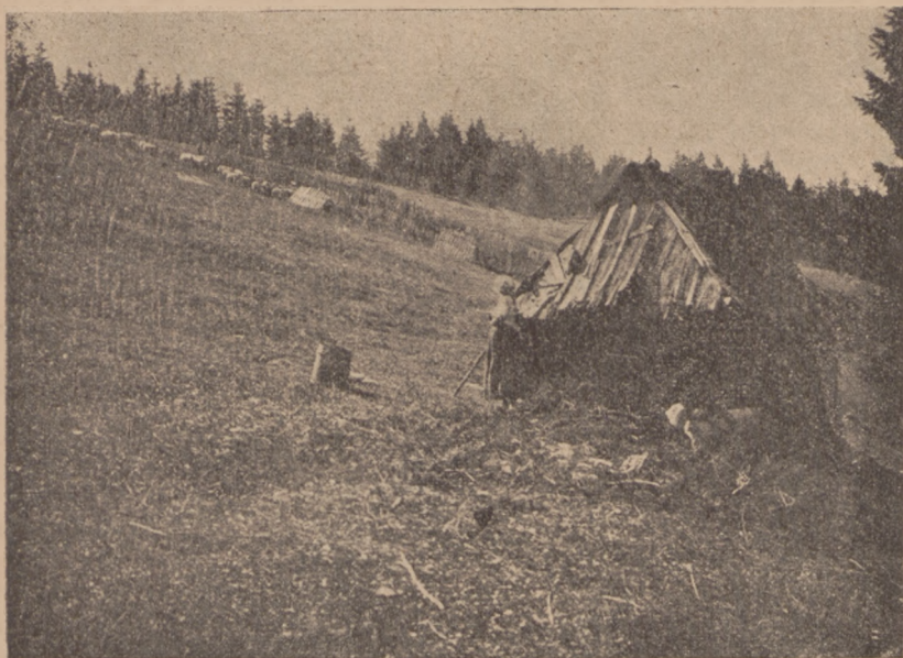
Szałas na Kopie (Mogielnicy 1171 m. n. p. m.).