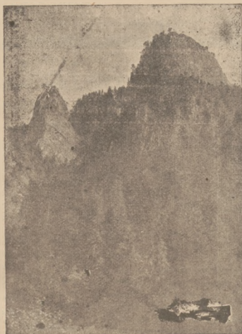
PIKNO PODHAŁA — PIENINY — SOKOLICA.

W samym Zakopanem przebudowano już szereg ulic, oraz dworzec, który nie nadawał się już do przepływu wielkich mas przybywających tu turystów.