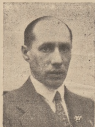
Nowy Marszałek Senatu plk. BOGUSŁAW MIEDZIŃSKI.

obcej, nienawistnej i własne, ciemne cele goniącej propagandy. Powinni jednak wiedzieć i to, że Polska wyciągniętej już dawno do Słowacji bratniej, pomocnej dłoni nie cofa. W chwilach najcięższych dla narodu słowackiego dłoń ta wspierała walczącą o swe prawa Słowaczczyznę wspierając ją będzie dalej, o ile nastąpi opamiętanie. Na wyrozumiałość polską liczyć może młody naród słowacki zawsze, tak jak nie zawiodła go ona w dniu, kiedy Polska przeprowadzała nowe rozgraniczenia, jakże skromną rektyfikacją granic ze Słowacją obejmującą. Wyrozumiałość nie oznacza jednak bynajmniej „świętej cierpliwości“. I ta zresztą ma swe granice.