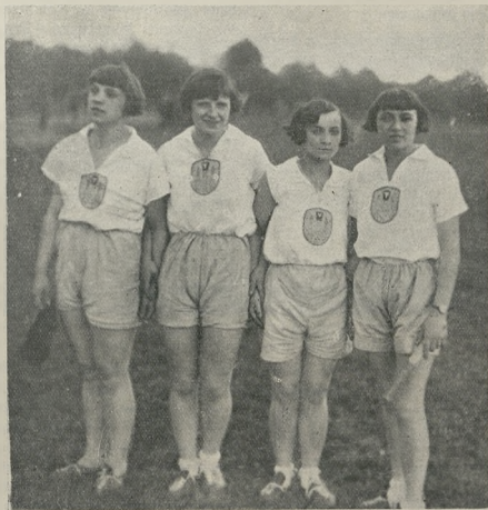
Sztafeta 4 × 100 Poznań.

opierając się na ogólnych zasadach prawnych. Zgóry zaznaczam, że wątpliwości nie nasuwają