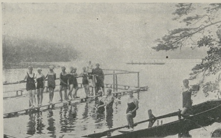
Obóz żeński w Koscierzynie lekcja pływania

Biegi na łodziach następujących typów (tylko wyciągowe)