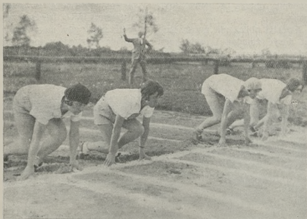
Poznań — Kraków. Start do biegu na 100 metr.

Bieg rozstawny 4×400 m. Wykreślenie zmian przy biegu sztafetowym 4×400 m., o ile takowy odbywa się na osobnych torach, jest technicznie łatwiejsze do przeprowadzenia, choć może nawet i bardziej skomplikowane. Znając bowiem obwód bieżni na wszystkich torach wychodzimy z założenia, że każdy zawodnik będzie biegał jedno okrążenie plus, względnie minus ilość metrów, przedstawiającą różnicę między