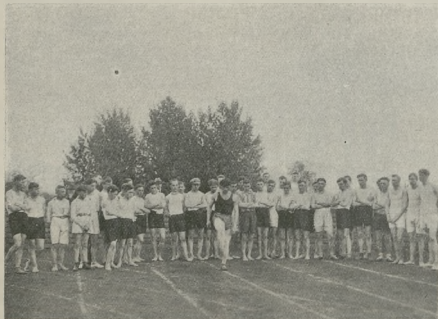
Kurs instruktorski w. f. Związku Powstańców Śląskich.

W zawodach indywidualnych torowych brać może udział 1 zawodnik z każdego państwa.