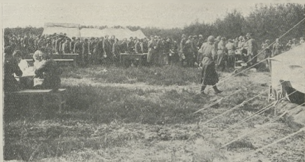
Obóz żeński w Kościelzinie w ogonku po 100y.

400 m.) musimy zastosować odejmowanie różnicy, t. j. odmierzenie w lewo (w kierunku biegu).