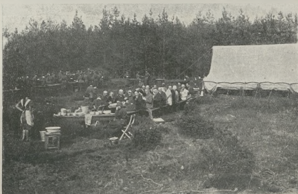
Żeński obóz p. w. w Kościerzynie.

U w a g a: — Znajomość obwodu bieżni na torze 4. (względnie ostatnim) bywa bardzo często potrzebna, gdy na podstawie różnic odbwodów toru ostatniego i pierwszego dokonywujemy wielu potrzebnych obli-