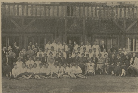
Zakończenie kursu podinstruktorskiego Przysp. Wojsk. Kobiet w Katowicach.

Szczegółowy program będzie dopiero ogłoszony.