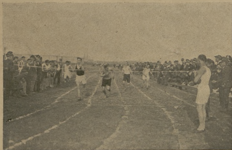
Fimisz biegu na 100 m.

Z uroczystości otwarcia boiska w Mikołowie.