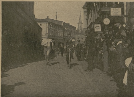
E. Mentrela z org. P. W. jako pierwszy na mecie.

I. miejsce — „Sokół” Król. Huta, czas 48 min.