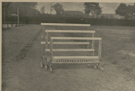
Na fotografii widzimy trzy wysokości dające się uzyskać dzięki nowemu ulepszeniu.

Jak się dowiadujemy, na wynalazek swój por. Gilewski uzyskał patent w Państwowym Urzędzie Patentowym w Warszawie i nowy model płotka zjawiał się już w sprzedaży *).