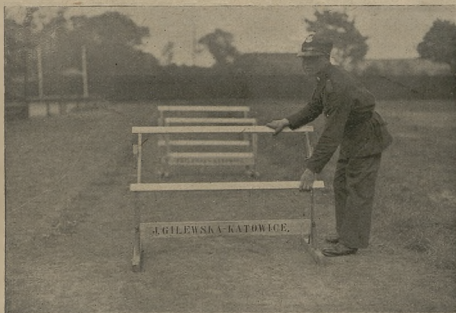
Nowy model płotka polskiego patentu i polskiego wyrobu.