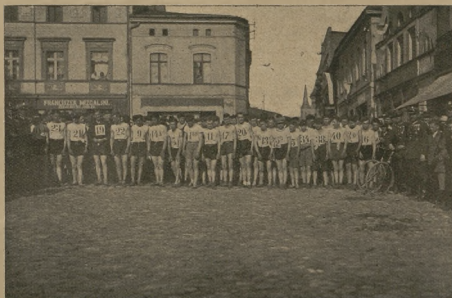
Zawodnicy na starcie.