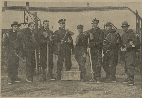
Z kursu instruktorów obrony gazowej L. O. P. P. w Krakowie w marcu 1930 r. Drużyna ratownicza podczas ćwiczeń.

Z „A. B. C. strzelania” J. Podolskiego. Wydawnictwo Związku Strzeleckiego.