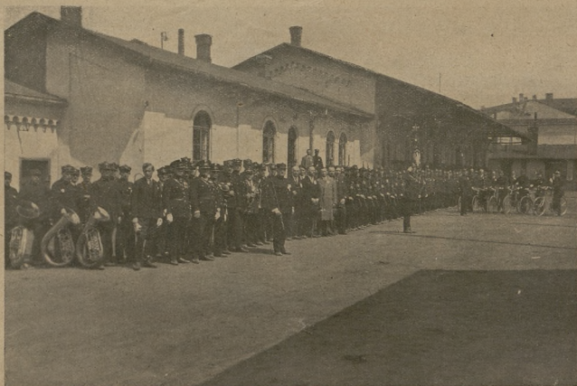
Ognisko Dziedzice Kol. Przysp. Wojskowego przed defiladą w dniu święta Narodowego.

ORGAN WOJEWÓDZKICH KOM. W. F. i P. W. KATOWICE-KRAKÓW-KIELCE