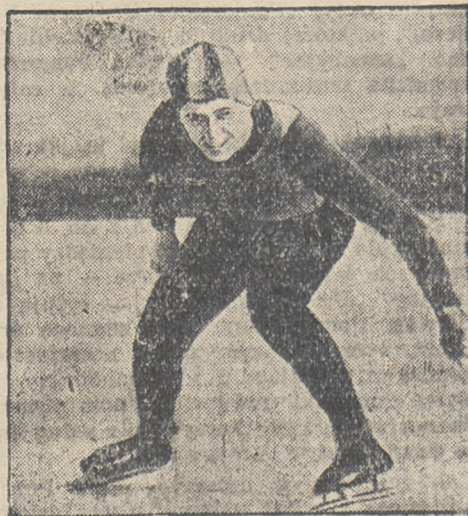
Pierwszy triumfator Olimpiady.

Międzynarodowy turniej hokejowy w Zakopanem. W trzydniowym turnieju hokejowym w Zakopanem, który zakończył się dnia 2 bm. pierwsze miejsce zajął Troppauer EV 6 punktów, stosunek bramek 11:0; 2) Sokół 3 p. st. br. 4:7; 3) reprezentacja Brna 2 p. st. br. 4:8; 4) Cracovia 1 p. st. br. 4:8.