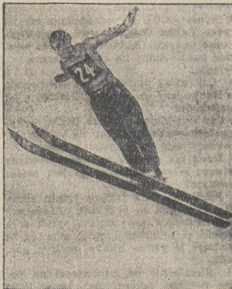
Między niebem a ziemią.

Konferencja, odbyta w Tczewie, uchwaliła wydać jednodniówkę Harcerstwa Pomorskiego z okazji 15-letnia pracy na ziemi pomorskiej.