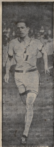
Lova (Anglja), 800 m.