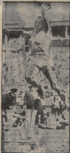
Hamm (USA.) skok wdal.