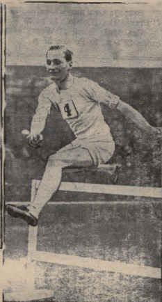
Lord Forghley (Anglja) 400 m. przez płotki.