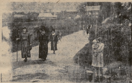
Anglikański biskup z Winchestera odbywa pleszko pielgrzymkę po awiej diecezji. Poprzedzają go skautki zapowiadając ludności zbliżenie się biskupa.