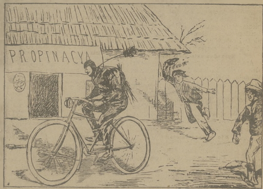
Diyahel na nowocze! patrz artykuł: Ze swiata.

To dziełno. Latu cede kradli, za kradzieże pamiętko bułali o młot się uisodonył, czy nie chcieli domyślnie przeciwnicy pamiętki, które z kieszeni kieszek płatnych podmuźdżków kolejowych tak bogatym płynęły strumieniem. Dziś, gdy szajka pod kluczem siedzi, każdy, co się z nimi stykał, mówi: ja wiedziałem, że to kradzieże pamiętki! Nie sztuka było wiedzieć. Jak długo się nie ma na złodzieja mowytych domow, tak długo nie się nie wie i wiedzieć się nie powinno. A z chęcią, gdy się koros i w bagnaty przyjdzie lub niezłote słowdy lero zbrodniczości ma w ręku, wtedy zwinie z nich użtyk na ochrone całego społeczeństwa. Niesłoty, przeprowadzone w tej sprawie śledztwo wykazało, że owcami tych dróg-zolemich kradzieży żywilo się wiele osób, które — choć w kradzieżach udziału nie brały — to jednak dobrze im było wia-