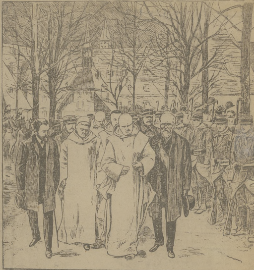
Z przedsidowani zakonow we Francji. Kartuzi z chęcią opuszczają klasztor pod groźbę bagnotow (patrz artykuł: Ze swiata).

domem, z jakiego źródła te niewyzerpane bogactwa kolejkowyk płyną, a już w każdym razie wiedzieć umiemy, że z czystego źródła one pochodzą nie mogą. Historia o kochającej ale głupiej żonie. Z chęcią opuszczają klasztor pod groźbę bagnotow (patrz artykuł: Ze swiata).