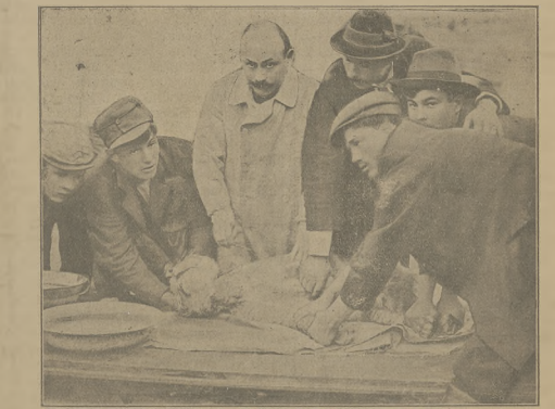
Operacja na lwie... w Rohatynie (patrz Ze swiata: Kronika ilustr.)