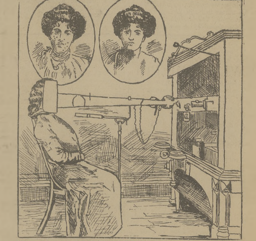
Promienie Rontgena na usługach piękności (patrz Ze swiata: Kronika ilustr.)

II. Nim przystąpimy do właściwej ankiety z członkami gmin przedmiejskich, z której to ankiety stopniowo uwiódniem się be- dzą zyski i szkody, jakie Kraków i okolice