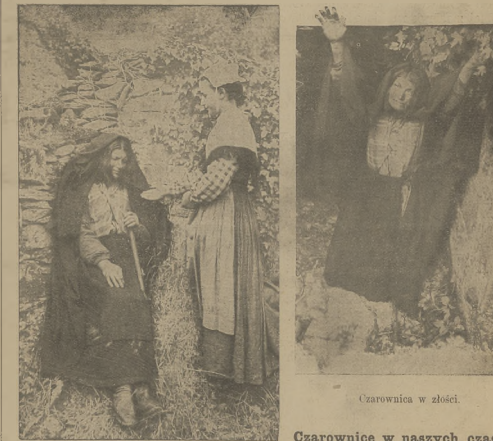
Odwiedziny w czarownicę.

nieszanowacizn urzadzen tego rodzaju w innych miastach. Hydrant podziemny skryty w bruku, nie tylko latwiej uloga zanieczyzczenie, ale i w naglych wypadkach ognia trudniej po odhaleniu, a juz najbardziej w zimie, gdy ulga zawalone za smiegiem lub bitem. P. Emilowicz wie, że wlasnego doswiadczenia, że dyspozycja taka popelnil bled wielki, ktoroze naprawienie tj. zmiana hydrantow podziemnych