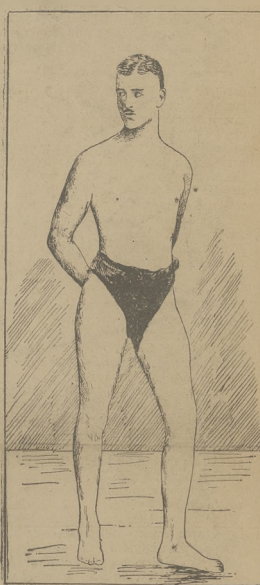
Najpiękniejszy mężczyzna (z konkursu piękności płecności w Wiedniu; patrz Ze swiata: Kronika Ilustrowana).