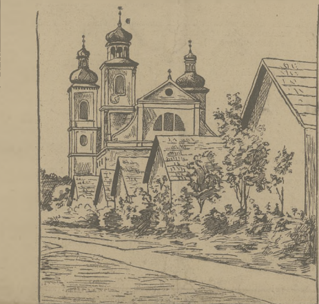
Klasztor na Bielanach.

Warunki przystępne. Dla Pań nauka oddzielnie.