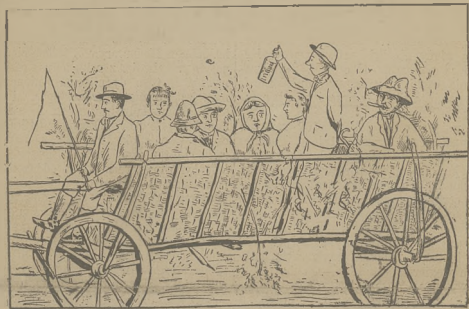
Jazda na Bielawy w weselnej kompanii