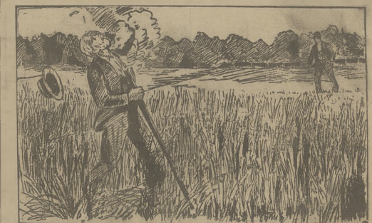
Originalne samobójstwo (patrz Ze swiata: Kronika Ilustr.)

We Francji, precyzyne gabinety Combesa partje, zainicjowując całą kani- pulation oskarżać o „szantaż” przeciw mini- strowi Pelletanowi i przeciw synowi pre- zydenta gabinetu, Edlgarowi Combesowi. Też znaczna większość kända te oskar- żenie oszczepstwa. Obawie antyzadowe deputowany Flaudin, z którym prezydent Combes miał na ostatnim posiedzeniu sejmy, oświadczył, iż przekonywany jest honorowości Edgara Combesa (syna) i zło-