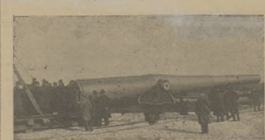
Największa armata na świecie, w Sandy Hook, pod Nowym Jorkiem (patrz Ze swiatla: Kronika ilustrow.).