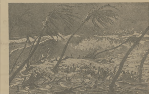
Katastrofa na wyspach Tuamotu (patrz Ze swiatla: Kronika ilustrow.).

Wczoraj, we czwartek, „Nowiny” wydały dwa wydania nadzwyczajne o goď. 3 i 4 wieczornem. Drugie wydanie zawierajło trzy portrety i zostajło rozchwytywane po kawiar-niach i restauracyach. Wydanie II, łączajcy do dzisiejszego numeru.