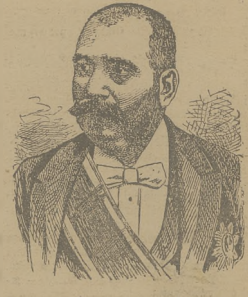
Jovan Avakumovic, obecny prezydent ministrów w Serbii.

Belgrad, 16 czerwca. Na deszczu rządu do króla, przesłana przez Awakumowic.