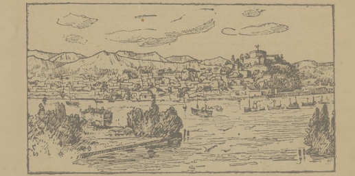
Widok Belgradu z przeciwnego brzoza Dunaju.

Na jesień i zimę polecam już Landauery, Landauety (szludane) Karety, Kabriolety.