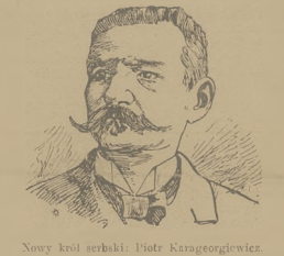
Nowy król serbski: Piotr Karageorgiewicz.

zgromadzenie wznosi okrzyk Zwio. To samo oswiadczenie się przy oddawaniu dalszych głosów.