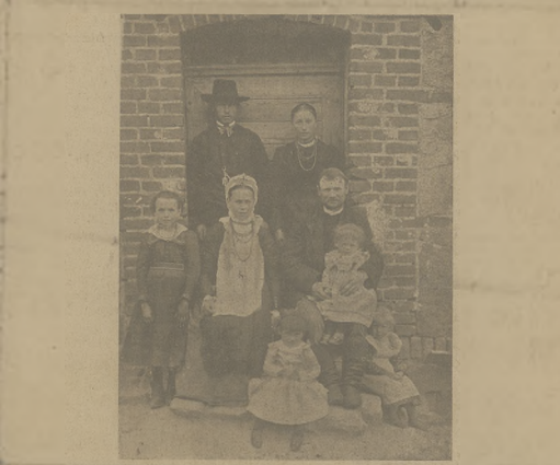
Typowa rodzina włoska z „Palac“ w Puzostankiem: gospodarz, Pani, dzieci i czeladź.

Rzym, 24 lipca. Natęok do kościoła obzhrny „ Dum plynie tak różnorodny. Obok arystokracji stama się najbiedniejsi robotnicy. W południe panował gorący wiatr „sirocco“, który przysparzał o omlelenie wielu mężczyz i 20 kobiet.