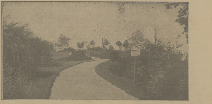
Wzgórze Wisniewskiego we Lwowie. (Dziś: Ze swiata; Kronika ilustr.)

gnątkę, za królów, co jedwabnie wiedziez życie! „Niestety ja dostaję od mego 4 reńskie 25 ct tygodniowo, co czyni ani nie 20 reńskich na miesiąc — i musiny żyć z tego, jak, to będzie opisać trudno. Życie za te pieniądze przestaje być walką, o byt, a zamienia się w walkę o honor. Po skie- pikach, w młeczarni, u węgla, wszędzie wisi się z tłumami, nie rzadko i komorne zostaje się winnym. Zła jest latem, zimną jeszcze gorzej. A gdy się niema czasu, w roku, rozpacz zbiera, bo taklin, co żyją z 4 guldenów tygodniowo, nikt nie po- życzy. Niechęć więc kłora z tych pań, co ma samo mieszkanie, wydaje więcej, niż ja wy- dać mogę na wszystkie potrzeby, rzeczy wytracaować i napisać, co by robiła z taką kwotą.” M. P.