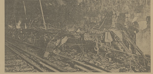
Widok spalonego pociągu w tunelu. (Katastrofa pożaru wywołała tak zw. „krótkie splecie” przewoźni elektrycznej, skutkiem czego zapali się jeden wagon. Pożar ogarnął rychło cały pociąg — a dym gęsty odział w ciemności mieszczących pasażerów dymnego pociągu, który nadszedł z przełaznej strony, a którego pasażerowie zawczasu opuścić nie chcieli.)