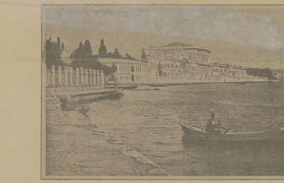
Jak sultan mieszka: Dolmabahçe, pałac sultana nad Bosforem (patrz: Ze świata: Kronika Ilustrowana).

becnym biegu wyprodukować koniecie dział- nisz. Ohie stromy walczył z bezwzględno- ścią i tak żołnierze turecy koło Kerin zniszczyli 5 wsi i wymordowali 200 chry- ścian, a w Diarotli wraz z nieświęcącimi spalili 40 mieszkańców. Powstały zaś napadłyżki koło Kastor na pociąg, zabili 60 żołnierzy tureckich.