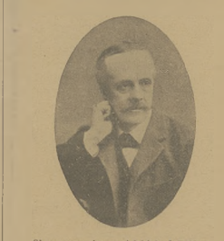
Obecny premier angielski lord Balfour.