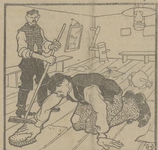
Sala balowa w Błotniach.