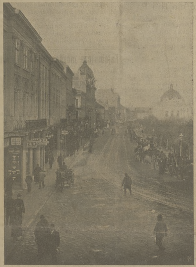
Z pobytu cesarza w Łwowie dnia 13 d. m. Ulica Karola Ludwika, przez którą monarcha przejeżdżał, udając się do katedry.

Wara, mot panowie, od faktyczności o- pinii, od tłumienia opinii, kraj i spo- łeczeństwo złożyły wczoraj wyrazy hołda i