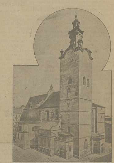
Katedra św. Jura w Łwowie.

ezni z stóp monarchy, przebywającego w pałacu namiestnikowskiem w Łwowie, aby stwierdzić swoją lojalność wobec osoby sprawiedliwego i najlepszej chęciami o- żywionego władcy. Lojalność naszą nie stoi jednak na zawadzie, abyśmy podnieśli energiczny głos protestu przeciw obecne- mu rządowi i przeciw kierunkowi polityki, uprawianej przez ludzi, którzy się mienią reprezentantami kraju, ale nie są nim.