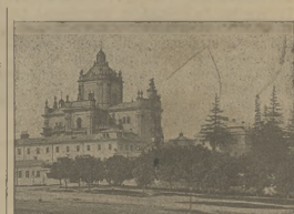
Świątynia św. Jura w Łwowie.

Deputację posłali na sejm prowadził marszałek hr. St. Bałeni. W przemowie swojej marszałek dał wyraz uczuciom wiero- ności i lojalności, jakie kraj żywi wzglę- dem monarchy, pod którego berłem kraj znalazł przystań dla swego bytu i rozwi- nia. Zapewnił też za reprezentacji kraju uczynia wszystko dla utrzymania wewnętrz- nej i zewnętrznej potęgi monarchii. —