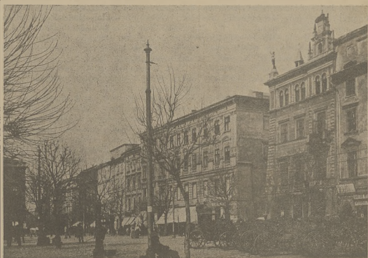
Na linii A—B w Krakowie. (Patrz artykuł).

I tak, nowo mianowany pomocnik otrzymał piątą w kwocie 90 koron miesięcznie (z czego jednakże odtrącają mu kwotę 2 kor. 95 hal.), tak, że otrzymuje on tylko kwotę 87 kor. 5 hal.; starszy pomocnik ma 100 kor., po odtrąceniu 3 kor. 25 hal., otrzymuje 96 kor. 75 hal.; w trzeciej klasie otrzymuje 110 kor., po odtrą-