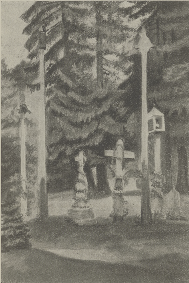
KAPLICZKI W „MIEJSCU ŚWIĘTEM“ WE WSI JAŚKI W PARAFJI RACZKI w pow. suwalskim.

MIESIĘCZNIK KRAJOZNAWCZY ORGAN KÓŁ KRAJOZNAWCZYCH MŁODZIEŻY POLSKIEGO TOWARZYSTWA KRAJOZNAWCZEGO