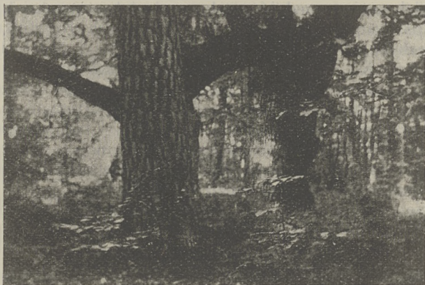
Puszcza Białowieża. Las mieszany.

nuży tylko trochę ta ciągła, błoga, aż usypiająca rajska wprost zieloność. Skończyły się błota, a zaczęły piachy; drożyna nasza przedziera się przez młody, gęsty zagajnik, a z tego znów wpada w bór potężnych, niebosiężnych, gonnych sosen-masztówek od wieków znanych w Anglii i Hiszpanji. Brodaty poganin, dąb prastary, bożyszczę, do którego przodkowie tubylców, Jadzwingowie, modły zanosili, objaty mu składając krwawe, jedyny niedobitek ze świętego Perkuna gaju, poważnie, jak do modlitwy wnosząc w niebo żylaste swe ramiona, strzeże wstępu do państwa grabów i innej leśnej hołoty, co ciżbą wielką wyrastają i gwałtownie pnąc się ku światłu, głuszą wszelkie wokół siebie życie. A pod ich sklepieniem mrok wieczny króluje, nie rośnie tu grzyb, ni zagładnie wąż, lis jeno czasem przemknie cicho i zbój-puhacz rad przed słońcem