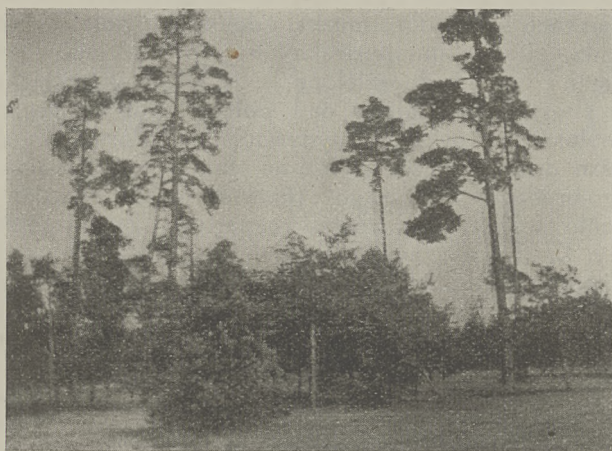
Polesie. Nasiennice wśród zagajnika.

ciwnie, w znojmym trudzie pionierskiej pracy-walki osadnictwa kresowego dzisiejsza tam narasta Polska, w obronie której w każdej chwili stanie huf rycerzy, z ziemi tej wyrosłych, co lemiesz na oręż zmieniwszy, stwierdzą raz jeszcze przed zdumionym światem, że my nie tylko byliśmy, ale wciąż jesteśmy owem niezłomnym, nieskruszonym antemurale christianitatis, broniącym kulturalny, acz gnuśny i samolubny Zachód przed zalewem wschodniego barbarzyństwa. I widzieliśmy w ruinie dorobek pokoleń całych, panującej tu ongi warstwy społecznej, oraz zniechęcenie i apatię starych tej kasty przedstawicieli, tudzież zapał i energję jej młodzieży, która w oparciu o nowoczesne ramy ustroju społecznego szuka ratunku dla ocalałych szacownych resztek... Przez cały lipiec tak