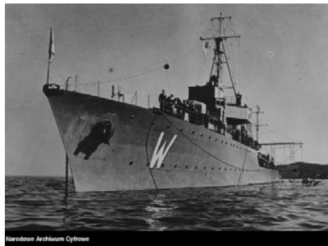
Rysunek 3. Niszczyciel ORP Wicher zakotwiczony na redzie