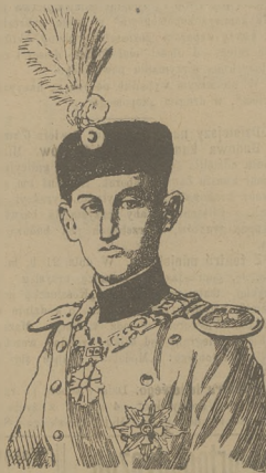
Serbski następca tronu ks. Jerzy.

W granicach z austro-węgierskimi posiadłościami okolicznych Serbii, panują uster niepomysłne stosunki zdrowotne: zła woda, gorączka i świerzb, do czego przyczynia się jeszcze brak odpowiedniego pomieszczenia dla wojsk.