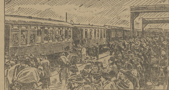
Pożegnanie rezerwistów na dworcu w Przemyslu.

I rzecewyci moja biedna klacz nie miała szesczenia. Ogładaj ją ten i ów, kaszane ją prowa-