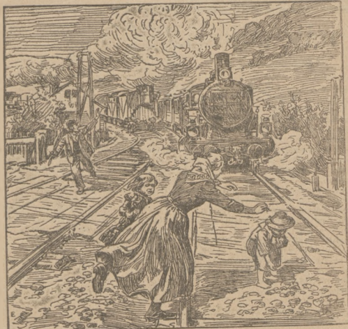
Troje dzieci przejeżdżających. (Patrz: „Ze świata”: Kronika ilustrowana).