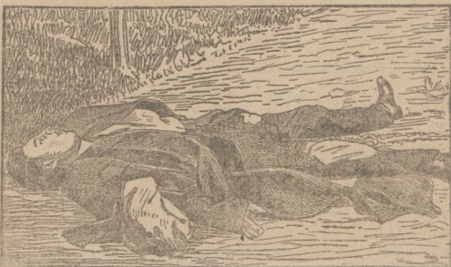
Eksplozja bomb w Paryżu: Rewolucjonista Striga, rozszarpany przez bombę (Według fotografii — Patrz: „Ze świata”: Kronika ilustrowana).