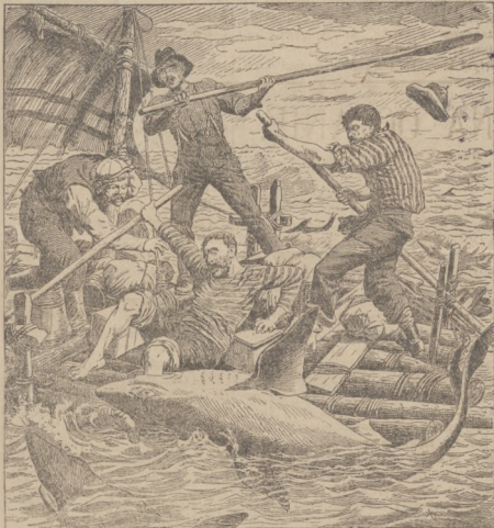
Strazna żegluga zbiegłych więźniów. (Peters: Ze świata: „Kronika ilustrowana”).

Dodatek pos. Starzyńskiego do ust. 2 § 35 (ścisły wybór) brzmi: „Te dwie osoby mają być jako wybrane uważane, na które względnie najwięcej głosów przypada”.