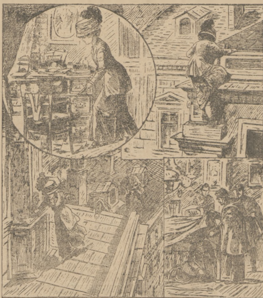
Narceozona w łamywaczka. (Patrz 'Rozmaitości')

Wzlotawa aeroplanu firmy Russwaki i Spw w Krakowie otwiera spotkanie we szwartek w sali hotelu Kleina.