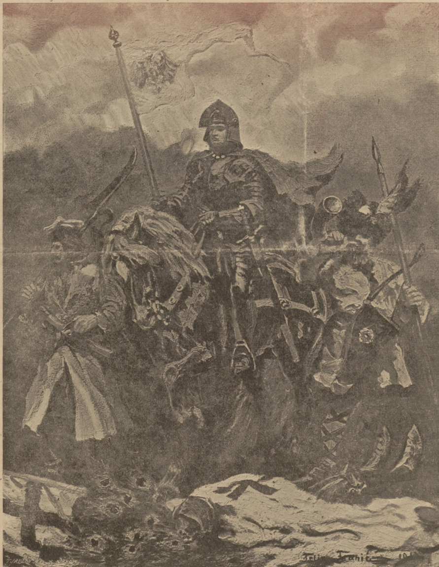
Malował F. Franci.

„NOWINY“ wychodzą codziennie wieczorem o godzinie 5-tej. — Cena numeru 3 centy w Krakowie i na prowincyi.