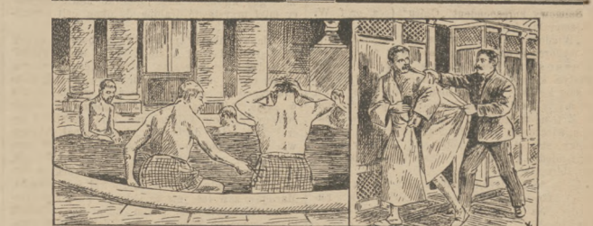
Szczur wodny. (Patrz „Rozmaitości“).

Po chwili, rzuciwszy okiem na barometr, spostrzegł, że „Patrie“ bardzo szybko opada. Wyrzucił