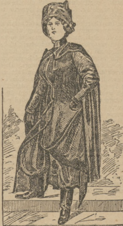
Antymodny kostium kobiety. (Patrz artykuł: «Moda przed półwiekiem a dzisiejsza».)

IV. Zgromadzeni wyrażają uznanie i podziękowanie posłom z Koła polskiego, w szczególności posłom