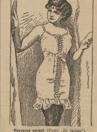
Pancerny gorset. (Patrz „Ze świata”).

W końcu zdecydował się i wybrał parę kolczyków za 240 dolarów, bransoletkę za 400 dolarów, broszkę za 125 dolarów, pierścionki brylantowe za 150 dolarów, a wreszcie odłożył na bok i szpilkę dla pana młodego za 100 dolarów. Wszystkie te klejnoty posiadały diamenty najczystszej wody — diamenty wartości 1025 dolarów.