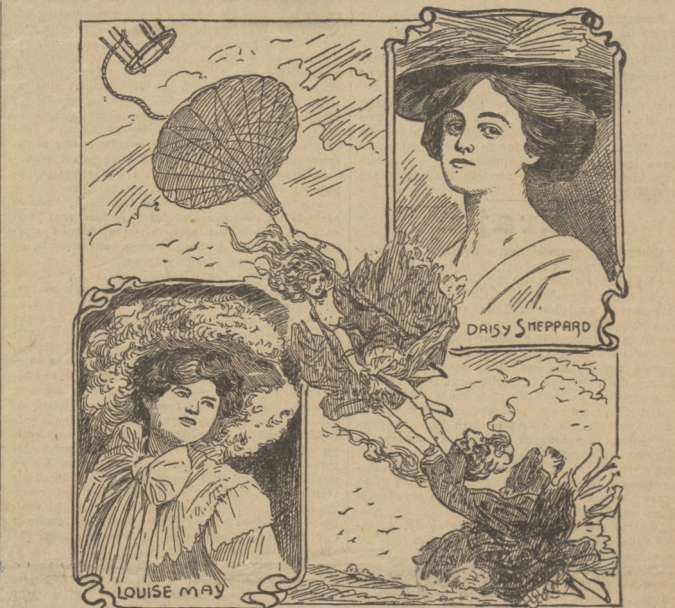
Popisy spadochron. (Patrz artykuł).

Herbatkami i postą Kozłowskiego prasa wiedeńska ogromnie się zajmuje. Sprawia to aż śmieszne wrażenie. „Neue freie Presse” aż uwa artykuły poświęca tym śniadaniom, złożonym z herbaty i bułek z masłem, wietrzac w nich niebezpieczeństwo dla Niemców.