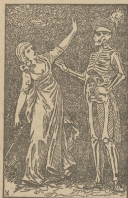
Röntgenowski obraz z XVIII wieku. Rycerz Gibello i contessa Abellina (Patrz ilustrację)

szkielet z chrapliwym śmiechem. Ona widziała przez jego szaty tylko nagie kości. Ilustracja nasza jest reprodukcją rycin z owego romanu. Widzimy przeto, że już w XVIII wieku wyrysowano szkielet a la Röntgen, nie domyślając się co prawda, że w XX wieku będzie można zapamięć naukowych przyrządów sporządzać takie „straszne” wzorki szkieletów.