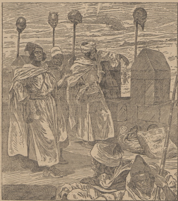
Na murach Fozu. (Patrz artykuł: Walki w Marekku).