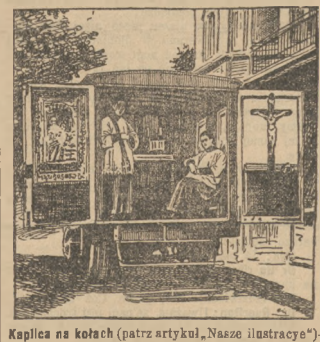
Kaplica na kołach (patrz artykuł „Nasze ilustracye“).

bezwzględny karierowiczem, który widzi w tym związku tylko swój posag. Ella: A ty? Edward: Ja widziałem tylko twoje oczy niebieskie, usta ponsowe, twoją cerę, tak białą. Ella: Czy mnie uważasz za sztandar narodowy? Edward: To głupie, co powiem, lecz z każdego sztandaru czuje się technienie oczyszczy, buntu, miłości. Z tobą, droga Elio, jak żołnierz z symbolem trójkolorowym, byłbym zdolny stać się bohaterem, wielkim człowiekiem, miliarderm, aby oczywiście bardzo szczęśliwie moje drogie oczy niebieskie, moje piękne usta czerwone, moja miła cerę białą. Ella (trochę wzruszona): To bardzo ładnie! Dlaczego mi tego nie oświadczyłeś wcześniej? Edward: Nie śmiałem. Kto kocha, jest lekkiwy. Ella: Wstydlivi rękę, moją mamę. Widzisz, to już za późno... Pani Verdere wchodzi do salonu; młoda dziewczyna gra dalej walca, a młody człowiek szarpie węs. Pani Verdere (do Edwarda z niecierpliwością): Nie idziesz do biura?