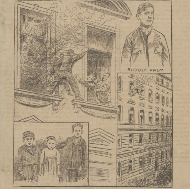
Niezwykły ratunek. (Patrz artykuł).

nas wzywał! A my pragnący tylko uczciwie zarobić na życie, stawiamy się ochoczo. Dziesięć tysięcy złotych za czasy na człowieka, którego porostawiamy na miejscu na pół martwego, ciężko ranę przynajmniej! Za porwanie dziewczyny to tylko dziesięć sztuk srebra! Uczciwie wywiązujemy się z zadania! Jesteś przecież córka wielkiego prefekta, w którego interesie leży wiedzienie, wieszanie i pale nie wdzęgow, ludzi bez ducha, niebieskich ptaków... Jesteś naszą nieprzycięcią, więc czemu nas chcesz ocalić? Mówił to słowa z dziką ironią, głuchym rozdraznieniem. Wierzył, że serce ma przepoludnione nianawścią, ale mówiąc trzymał spużnioną swą piękną głowę o profilu Kamei. I skłoniwszy, podniósł ją i spojrzal na Florisę. Urząd, iż przy spływają zwolna po jej policzkach... Cofnął się w tył, tak bezprytnym, tak chwycić się, jak gdyby ujrzał mającą go pochłoniąca roztrwierającą się przed nim ziemię.