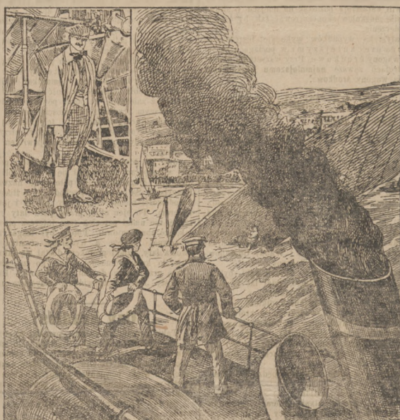
Kapitel lotnika. (Patrz artykuł).

Jak w podobnych wypadkach, okazuje się i tu,