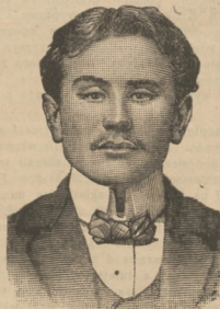
Łódź, 12-go lutego, 1911 r.