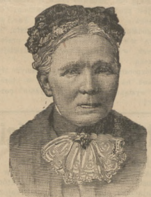
Tarnopol, 16-go lutego, 1911.