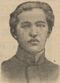
Łódź, 5-go lutego, 1911 r.