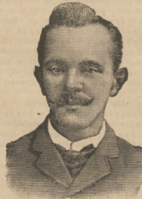
Lublin, 26-go lutego, 1911 r.