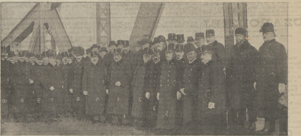
Uroczystości kanałowe w Krakowie. Dygnitarze zbrani na nowym moście na Wiśle. 1. Minister skarbu eksc. Zaleski. 2. Eksc. dr Biliński, prezes Koła polskiego. 3. Min. robót publicznych Trnka. 4. Min. dla Galicji Dingosz. 5. Szef sekcji w min. handlu Zampach. 6. Komendant korpusu imp. Böhm Ermolli. 7. Namieśnik eksc. dr Bobrzyński. 8. Delegat nam. Fedorowicz. 9. Radca dworu Ingarden. 10. Szef sekcji Pranter.

Prez. Biliński na wstępie odczytał depeze powitawne prezydenta gabinetu hr. Stürgkh'a i mini-